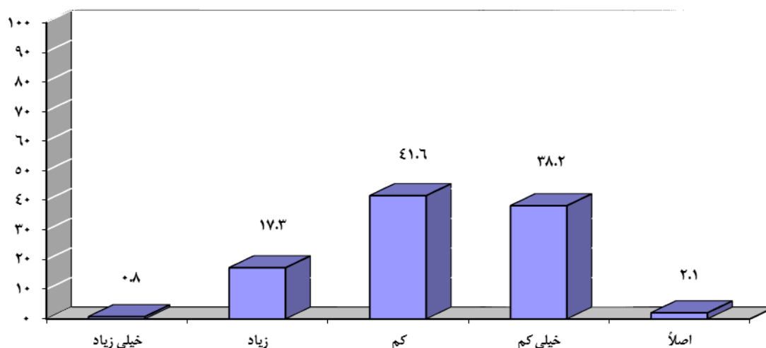
نمودار ۲ - شاخص اعتماد کلی نشریه و روزنامه‌ها به اخبار خبرگزاری‌های خارجی از نظر پاسخ‌گویان (درصد)

شاخص اعتماد کلی به خبرگزاری‌های خارجی از مجموع میزان اعتماد نشریه و روزنامه محل کار پاسخ‌گویان به اخبار خبرگزاری‌های خارجی (CNN, BBC, NBC, الجزیره و رویترز) به دست آمده است. در مجموع ۱۸/۱ درصد روزنامه و نشریه محل کار پاسخ‌گویان به اخبار خبرگزاری‌های خارجی در حد «خیلی زیاد و زیاد» و ۷۹/۸ درصد در حد «کم و خیلی کم»